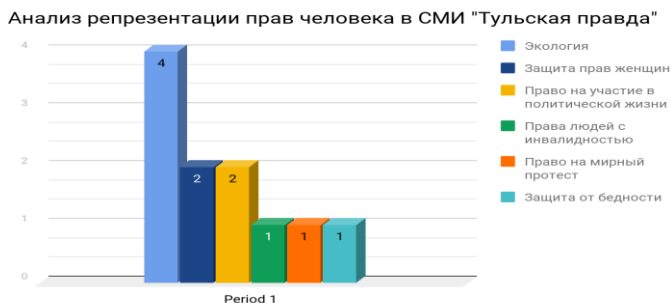
Рисунок 2. Репрезентация прав человек в СМИ “Тульская правда”

Другие вопросы прав человека вообще не представлены (права ЛГБТ, проблема бедности, свобода СМИ и некоторые другие вопросы).